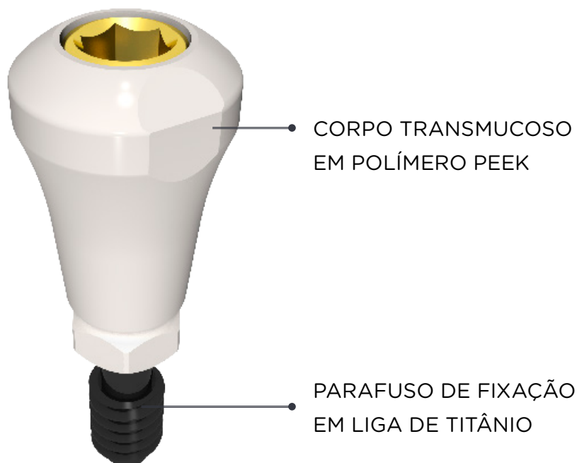
Modelo esquemático das partes que compõe o Componente Plenum® - Cicatrizador.

O Componente Plenum® - Cicatrizador é composto em duas (2) peças: 1. corpo do componente, fabricado em polímero PEEK (poliéter-éter-cetona), conforme especificações da norma ASTM F2026 e ABNT NBR 15723-8; 2. Parafuso pas-sante de fixação, fabricado em liga de titânio (Ti-6Al-4V), conforme norma ASTM F136.