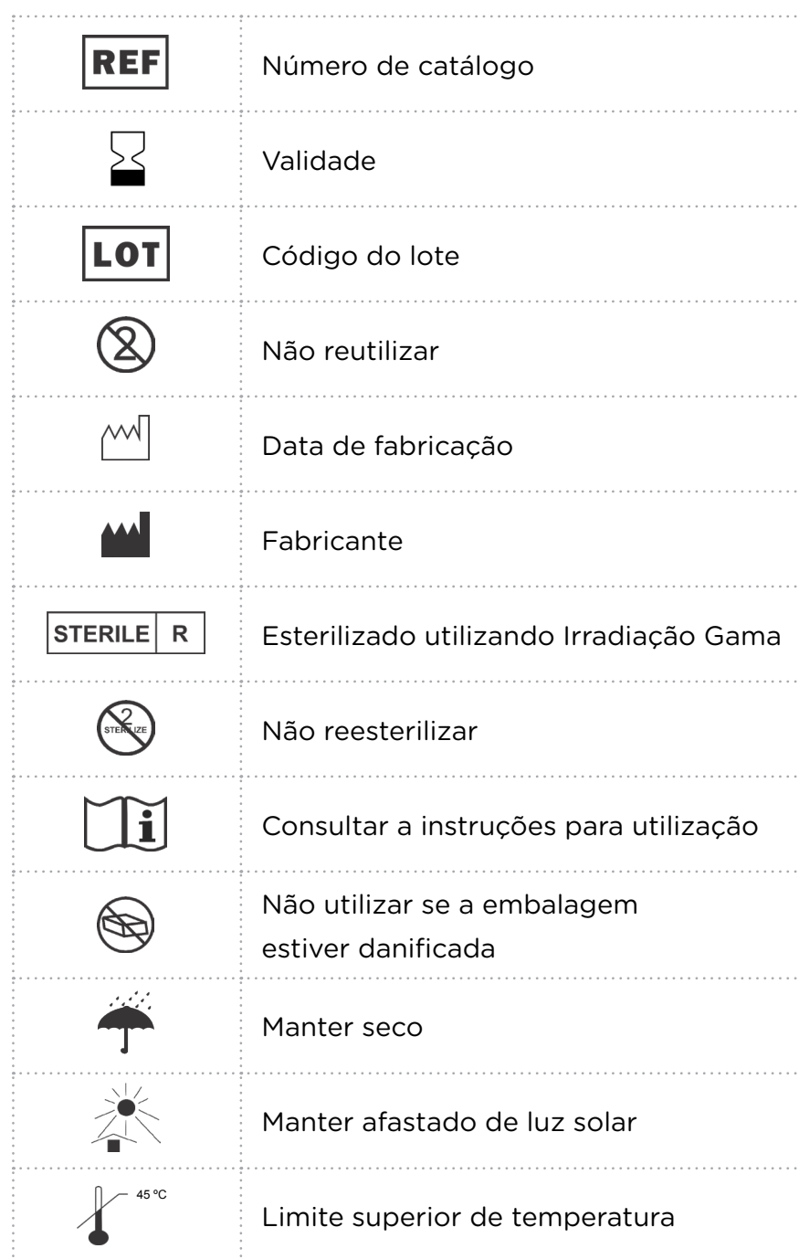
TABELA 2. Símbolos que representam normas e conformidades associadas ao produto e seu uso.

→ NOTA: Os símbolos gráficos relacionados à rotulagem do Componente Plenum® - Cicatrizador, referenciados acima, atendem aos requisitos estabelecidos na norma ISO 15223-1.